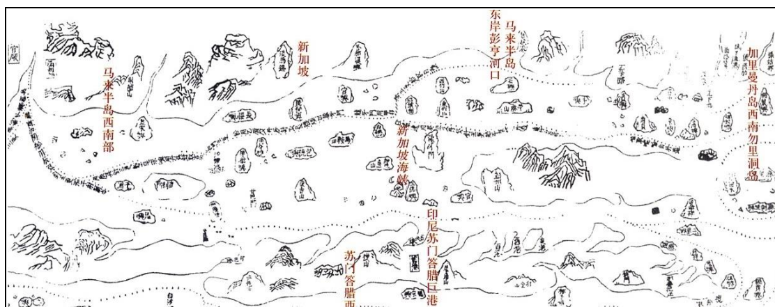
鄭和航海圖之一段，可見航海以地形、地物為指標。圖中紅字為今人所加。

從 1996 年 7 月起，我在《科學月刊》開闢「畫說科學史」專欄，至 1997 年 6 月，一共寫了 12 篇，為期一年。1997 年 5 月號，刊出的是〈明代的麒麟——鄭和下西洋外一章〉，我將《中國大百科全書·交通卷》的鄭和航路圖，和《國家與人民》的阿拉伯人通商航路圖列出，並寫道：